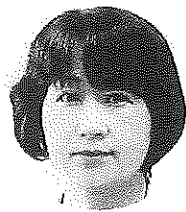
一般社団法人 日本ヒープ協議会

また昨年、消費者教育推進法が成立し、企業の消費者教育への取り組みにもますます関心が高まる中、当協議会が持つネットワークを更に活かして消費者教育の推進に向けて活動していくことが求められていると感じております。