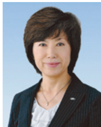
講師プロフィール